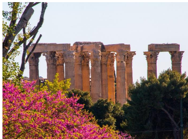
Zeustemplet i aftenlys set fra parken ved Zappion

Stor tak til alle på Det Danske Institut – og på snarligt gensyn.