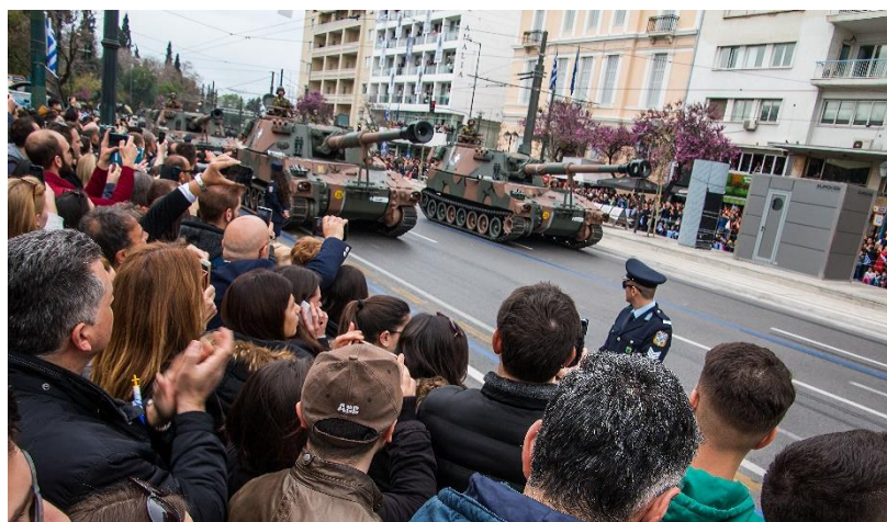
Det græske militær viser det helt tunge isenkram frem hvert år den 25. marts