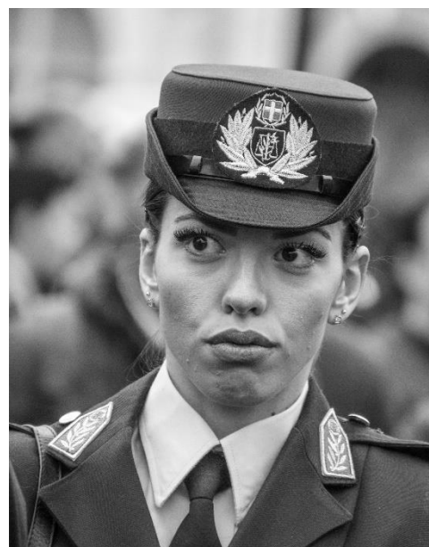
Græsk soldat på Syntagmapladsen