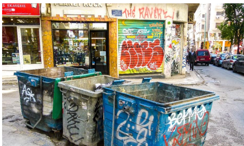
Exarhia, Athens svar på Nørrebro – et spændende kvarter, der bestemt et besøg værd