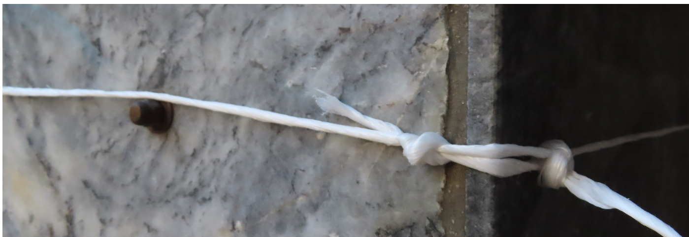
Marmor i Athen, 2021